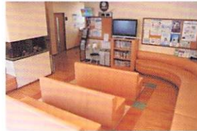
落ち着いた雰囲気の待合室