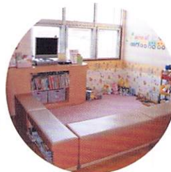
お子様を退屈させないプレイルーム