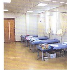
ゆったりとした処置室