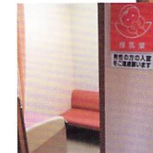
授乳室完備で小さなお子様をお連れの方も安心です

乳児健康診査には大きな三つの目的があります。 発育 発達 診察での異常の有無 です。 身長や体重を測定し、運動や知的な発達について診察致します。